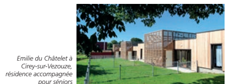
Emilie du Châtelet à Cirey-sur-Vezouze, résidence accompagnée pour séniors

Tel est le nom du dernier ouvrage produit par mmH pour présenter un autre regard sur l'habitat social. Nous vous invitons à des promenades architecturales dans le parc immobilier de mmH en consultant le document sur la page d'accueil de notre site internet www.mmhabitat.fr