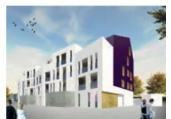
résidence Florescence à Pont-à-Mousson, adaptée pour des personnes âgées et à mobilité réduite