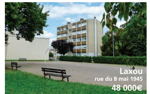
Laxou rue du 8 mai 1945 48 000€

Cet autre appartement T5 de 89m² à 72 000€ dans copropriété de 30 lots, charges annuelles de copropriété estimées à 1920€, CLASSE ENERGIE D