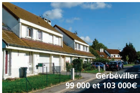
Gerbéviller 99 000 et 103 000€

Pour tout renseignement, contactez : Alfred de PABLO au 03 83 17 56 67 (adepablo@mmhabitat.fr), Mélanie COLSON au 03 83 17 56 81 (mcolson@mmhabitat.fr) ou en vous rendant à l'agence commerciale du Grand Nancy, 16 rue de Serre à Nancy (près de la gare)