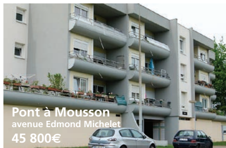
Pont à Mousson avenue Edmond Michelet 45 800€

2 pavillons avec jardin et garage. A 99 000€€€ T5 rue du Xaintois. CLASSE ENERGIE F A 103 000€ le T4 à ossature bois de 101 m² situé rue du Toulois. CLASSE ENERGIE E