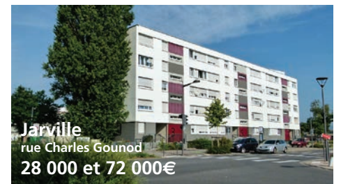
Jarville rue Charles Gounod 28 000 et 72 000€

T2 de 50m² dans copropriété de 18 lots. Charges annuelles de copropriété estimées à 1812€ (chauffage et eau compris). CLASSE ENERGIE C