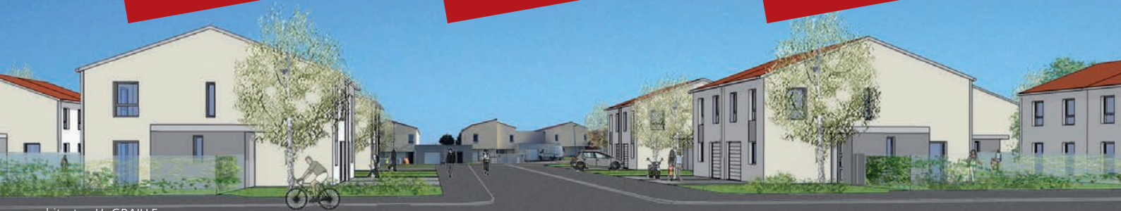
architecte : H. GRAILLE

Renseignements : société Le Nid tél. : 03 83 36 42 20 courriel : contact@le-nid.fr site internet : www.le-nid.fr