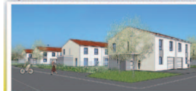
16 T5 de 102 m 2 - Livraison prévue automne 2013

Et prochainement à TOMBLAINE MARENCHÈNE... et à MAXEVILLE "Les Jardins Maraîchers"