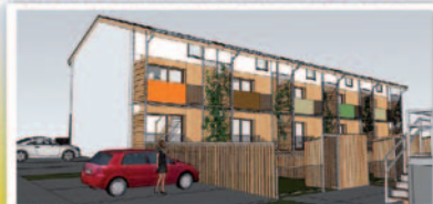
12 T5 - Livraison prévue fin 2013

lettre d'informations des résidents de meurthe & moselle HABITAT Directeur de la publication : Jean-Paul CRUCIANI, directeur général. Responsable de la rédaction : Fabrice GARLAND. Illustrations : mmH. Impression : Atelier Lorrain. Tirage : 16000 exemplaires. ISSN 1772-9122. Dépôt légal n°1593 mmH 33, boulevard de la Mothe BP 80 610 54010 Nancy cedex - 03 83 17 55 55 - meurthe & moselle HABITAT est un Office Public de l'Habitat SIREN 783 329 774 R.C.S. Nancy Impression sur papier PEFC / 10-31-1260 par des ateliers certifiés PEFC / 1-013