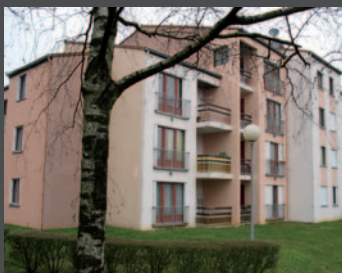
Les ¾ des ventes sont réalisées au profit des locataires de mmH (en photo, Jarny, Le Coin du Bois).

Agence commerciale du Grand Nancy, 16 rue de Serre NANCY (près de la gare)