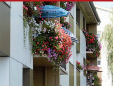
Résidence Mercure à Badonviller

Votre commande sera prise en compte lors de votre inscription. Pour récompenser vos efforts et après vérification par nos agents courant juin, une somme variant entre 25 et 50 euros sera déduite de votre loyer cet automne. La décoration des fenêtres et balcons sera récompensée de la même manière.