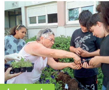
cadre de vie